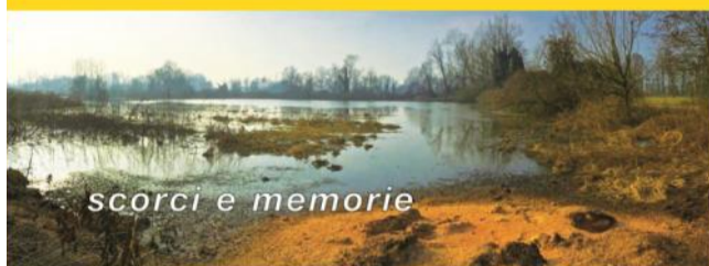
scorci e memorie